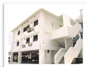
有老老人ホーム (併設) 憩いの里 首里センター